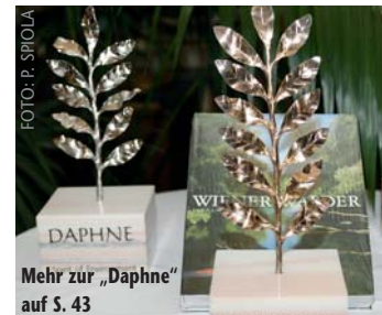
Mehr zur „Daphne“ auf S. 43

The hydraulic turbine system, which is specially designed for semi-regulated applications, offers a wide range of adjustment options, so that efficiency can be kept fairly constant throughout the entire range of applications.