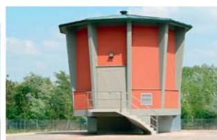
The Lobau is a valuable natural relict on the city's outskirts Insert: MA 31's groundwater pumping station Lobau