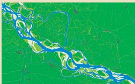
(oben) Die Lobau im Jahr 1817 und 2001 / (top): The Lobau in 1817 and in 2001

Einstmals dynamisch mit der Donau verbunden, trennte der im Zuge der großen Donauregulierung des 19. Jhdts. errichtete Hochwasserschutzdamm die Lobau weitgehend vom Fluss ab. Die zunehmende Eintiefung der Donau sorgte für eine weitere Entkopplung des Auegebiets vom Abflussgeschehen des Stromes und führte zu gravierenden Veränderungen der hydromorphologischen Dynamik. Heute präsentiert sich die Lobau als grundwassergespeiste Auenrandzone, die bei Hochwasser rückflutend an die Donau angebunden ist. Vorherrschend sind Verlandungs- und Sedimentationsprozesse. Die Lobau weist eine hohe Biodiversität auf und ist als Ramsar- und Natura-2000-Gebiet und als Teil des Nationalparks Donau-Auen besonders geschützt. Neben ihrer Funktion als Retentionsraum für Hochwässer wird die Lobau für die Trinkwassergewinnung („Grundwasserwerk Lobau“) und für die Naherholung genutzt. Die landwirtschaftliche Nutzung läuft 2017 aus.