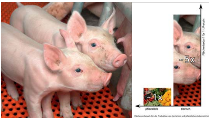
The amount of resources (in this case space) consumed for the production of animal foodstuff (e.g. pork) is much higher than for the production of vegetables

Der Ressourcenverbrauch (hier an Fläche) für die Erzeugung tierischer Nahrungsmittel (z. B. Schweinefleisch) ist wesentlich höher als jener zur Erzeugung pflanzlicher Nahrungsmittel